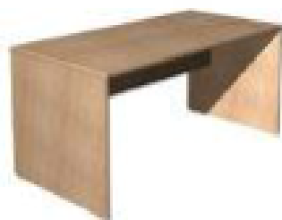
b) Kancelársky stôl – typ II