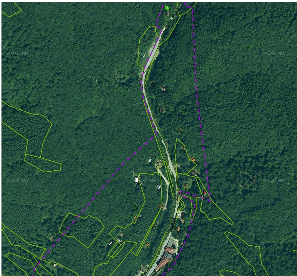
Príloha č. 2 – Celková výmera predmetu nájmu