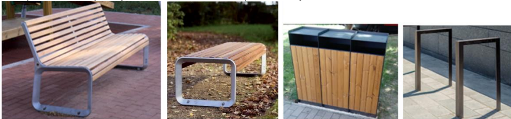
Obrázok č. 2: Ukážka mobiliáru