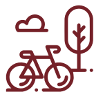
Vitalita a pohyb