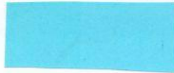
Firma / meno priezvisko zákazníka Obec Šumiac