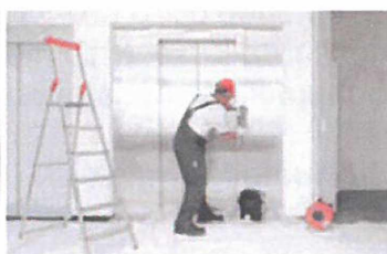
Servis 24 hodín