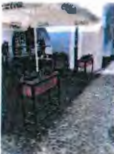
obr. kvetnace na oddelenie teras