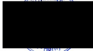
Ladislav Cigáň štatutárny zástupca