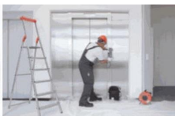
Servis 24 hodín