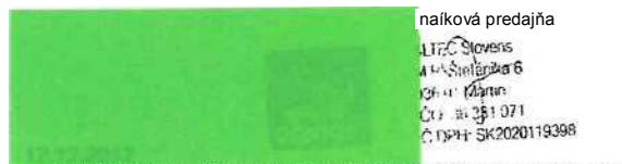
Spoločnosť Orange Slovensko, a. s. dátum, pečiatka a podpis